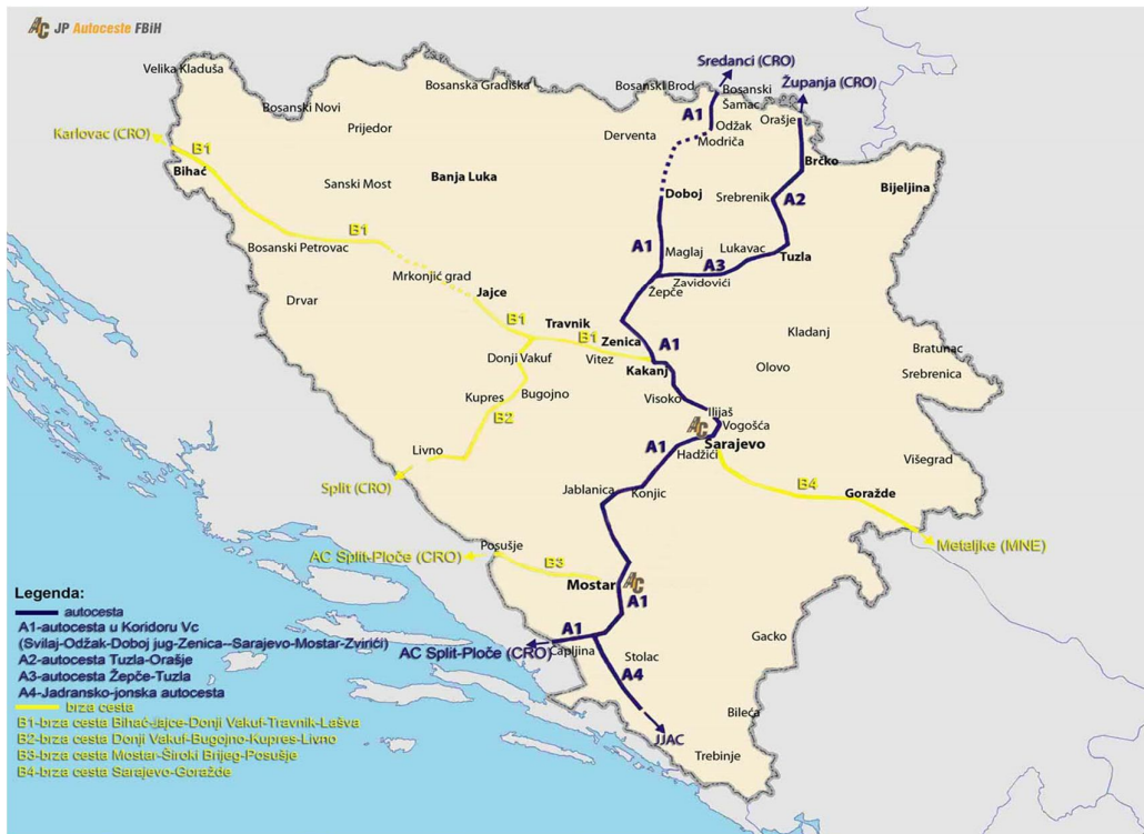
Slika 1. Pregled trase Koridora Vc i brzih cesta u Federaciji BiH

Pregled trase Koridora Vc i brzih cesta prikazan je na sljedećoj slici: