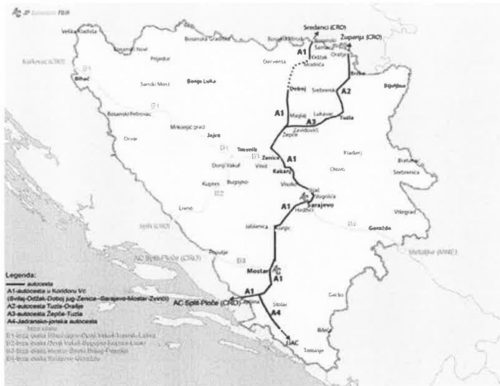
Slika 1. Pregled trase Koridora Vc i brzih cesta u Federaciji BiH

Dio Koridora Vc koji prolazi kroz Federaciju BiH iznosi 273 km. Pored ovoga planirana je i izgradnja autoputa Žepče – Tuzla – Brčko – Orašje, te nekoliko brzih cesta kao osnov za povezivanje Federacije BiH u regionalne i dalje međunarodne saobraćajne tokove savremenim cestama: