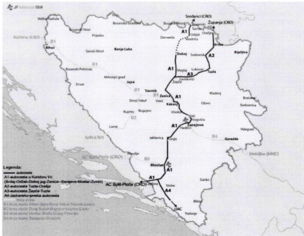
Slika 1. Pregled trase Koridora Vc i brzih cesta u Federaciji BiH

Dio Koridora Vc koji prolazi kroz Federaciju BiH iznosi 285 km. Pored ovoga planirana je i izgradnja autoputa Žepče – Tuzla – Brčko – Orašje, te nekoliko brzih cesta kao osnov za povezivanje Federacije BiH u regionalne i dalje međunarodne saobraćajne tokove savremenim cestama: