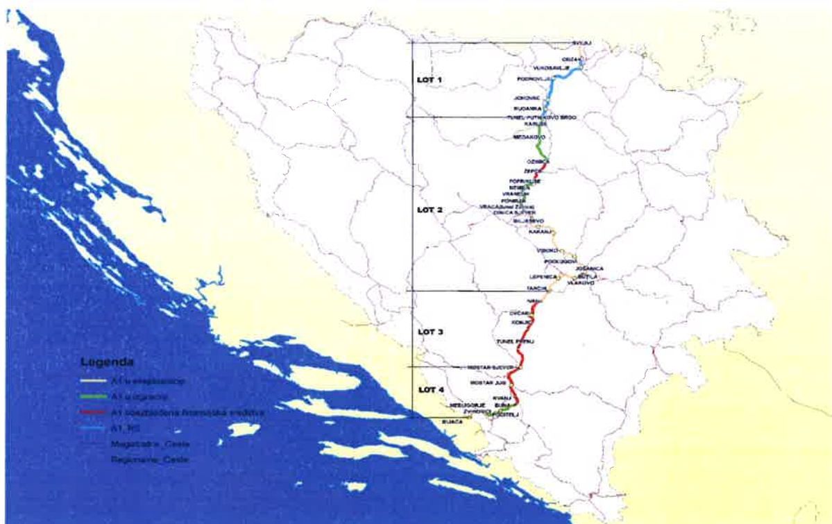
Slika 1. Pregled trase Koridora Vc u Federaciji BiH

Pored ovoga planirana je i izgradnja autoceste Granica RH – Orašje – Tuzla, Jadransko – jonska autocesta, te brze ceste: BC Lašva – Travnik – Jajce, BC Prača – Goražde, BC Bihać – Cazin – V. Kladuša – granica RH, BC Mostar – Polog – Široki Brijeg – granica RH.